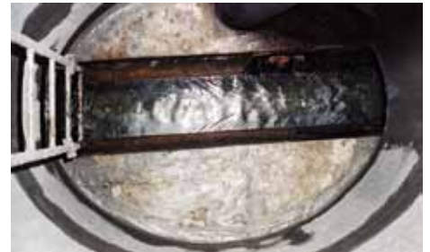
6. Sanierter Kontrollschacht