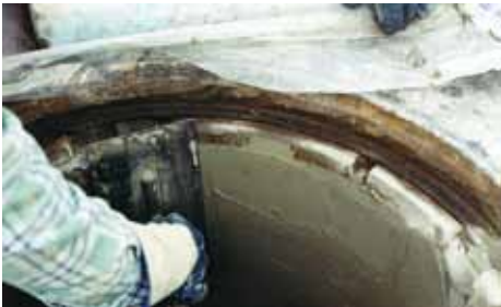
4. Beschichten des Schachtkonus mit VANDEX SPACHTEL RAPID