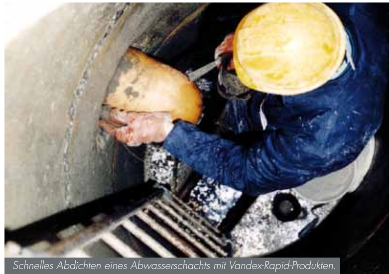
Schnelles Abdichten eines Abwasserschachts mit Vandex-Rapid-Produkten.

Das Rapid-System umfasst einen Stopfmörtel für Wassereintrübe, einen Reprofilierungsmörtel für Ausbruchstellen, einen Reparatur- und Dichtungsmörtel für Ausbesserungen und Beschichtungen sowie einen Spachtel für glatte Endbeschichtungen.