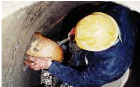
2. Stopfen der schadhaften Rohreinleitungen und Fugen