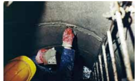
3. Reprofilieren der Fugen mit VANDEX MÖRTEL RAPID