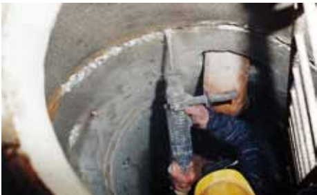
1. Ausspitzen der schadhaften Risse und Fugen