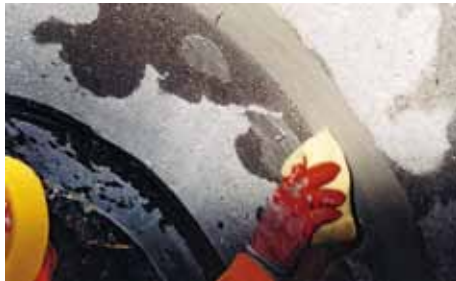
5. Abglätten von VANDEX SPACHTEL RAPID mit dem Schwamm